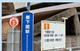
唐戸へは、1番乗り場