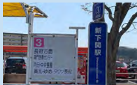
城下町長府へは、3番乗り場