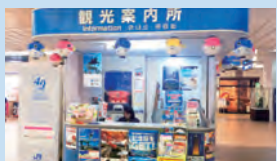
観光案内所 (9:00~13:00、14:00~18:00) ☎083-256-3422